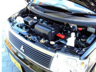
ekワゴン or ekクラッシー