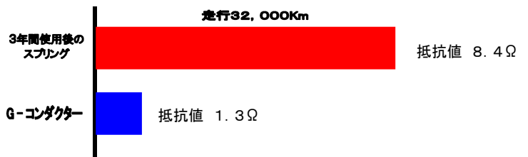
G-コンダクターと3年間使用したスプリングの比較